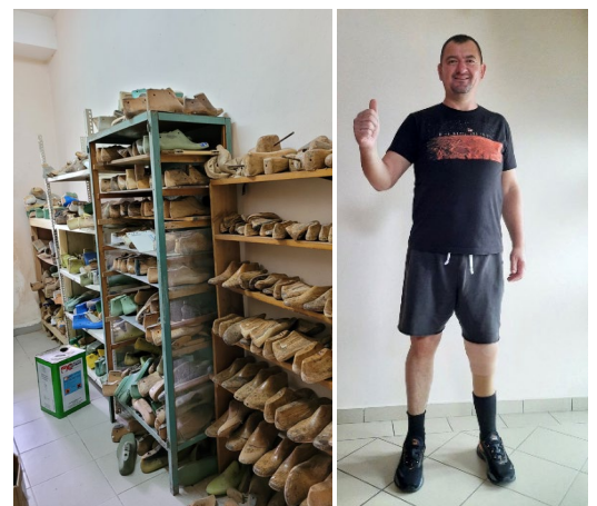
Fotografija lijevo snimljena u albanskom Protetičkom centru. Slika desno, koju je obavezio SMAC prikazuje preživjelu žrtvu nakon stavljanja proteze.

Ova brošura je napravljena uz podršku Evropske unije.