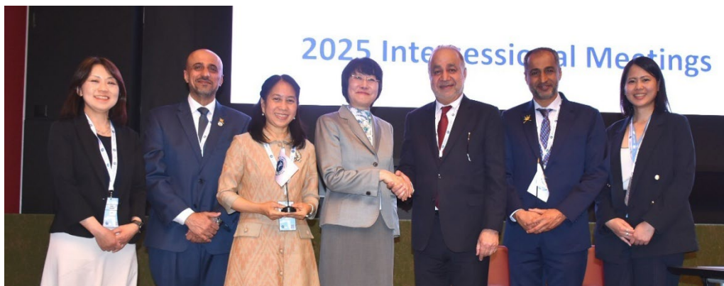
La foto de arriba muestra a la delegación omaní siendo felicitada por la Presidente de la Convención y la Presidente del Comité del Artículo 5 de 2025, Tailandia.

1999 Bulgaria | 2002 Costa Rica | 2004 Yibuti, Honduras | 2005 Guatemala, Surinam | 2006 Macedonia del Norte 2007 Esuatini | 2008 Francia, Malawi | 2009 Albania, Grecia, Ruanda, Túnez, Zambia | 2010 Nicaragua 2012 República del Congo, Dinamarca, Gambia, Jordania, Uganda | 2013 Alemania, Bután, Hungría, Venezuela 2014 Burundi | 2015 Mozambique | 2017 Argelia | 2020 Chile, Reino Unido* 2025 Omán