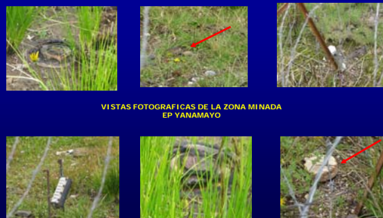
VISTAS FOTOGRAFICAS DE LA ZONA MINADA EP YANAMAYO