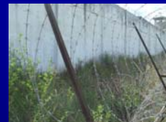
VISTAS FOTOGRAFICAS DE LA ZONA MINADA EP HUACARIZ